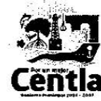
Tabulador de Remuneraciones Netas del Personal de Tránsito 2025